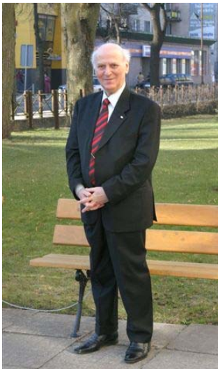
Šalva Amonašvilis

Tiek visuomenėje, tiek ir Lietuvos Mokykloje jaučiamas akivaizdus Humanistinės pedagogikos (HP) idėjų ir šių, žmoniškumą liudijančių vertybinių nuostatų taikymo ugdy-mo procese, vadovavimosi jomis pedagoginėje veikloje sty-gius. Todėl PAPA puslapiuose daug dėmesio skiriama HP vertybių sklaidai. Žinant sudėtingą šalies socialinę situaci-ją, suprantant jos optimizavimo svarbą norėčiau 2009 / 2010 m. m. PAPA numeriuose talpinti bent po vieną peda-goginę miniatiūrą „pasiskolintą“ iš žymaus HP kūrėjo ir puoselėtojo Šalvos Amonašvilio knygos 21 . Norėčiau tikėti, kad šios miniatiūros paskatins dažną Vaiko asmenybės Ug-dytoją susimąstyti dėl taikomų pedagoginių priemonių pa-grįstumo, jų korekcijos ir efektyvumo.