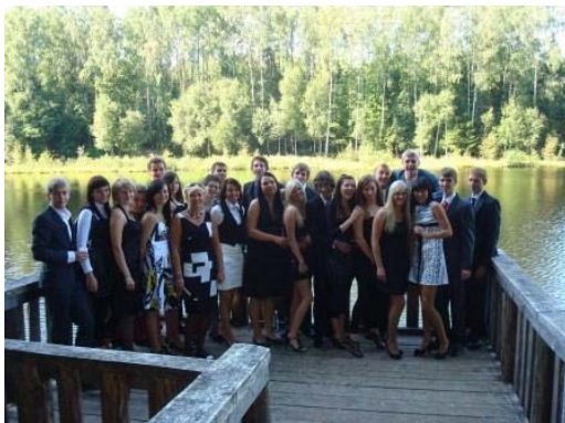
Prie Ilgės ežero. "Gera kartu..."