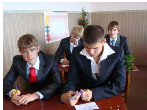
"Jie tokie gražūs, kai mąsto..."