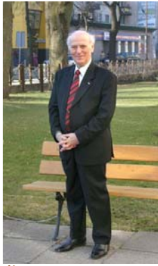
Šalva Amonašvilis

Žinant sudėtingą šalies socialinę situaciją, suprantant jos optimizavimo svarbą 2009 / 2010 m. m. toliau publikuojame ištrauką (pradžia - PAPA-41) iš žymaus Humanistinės pedagogikos puoselėtojo Šalvos Amonašvilio knygos „Gyvenimo mokykla. Mokyklos tiesa“ (235-236 p.).