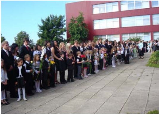
Mokyklos aikštėj. „Ir kalbų šiomet klausytis norisi...“