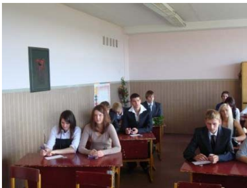
Klasėje. „Ir ką gi: Aš galiu...?“