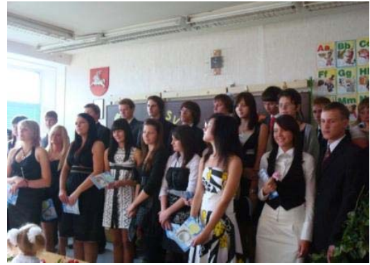
Pas pirmokus. „Ar dideli mes užaugom?“