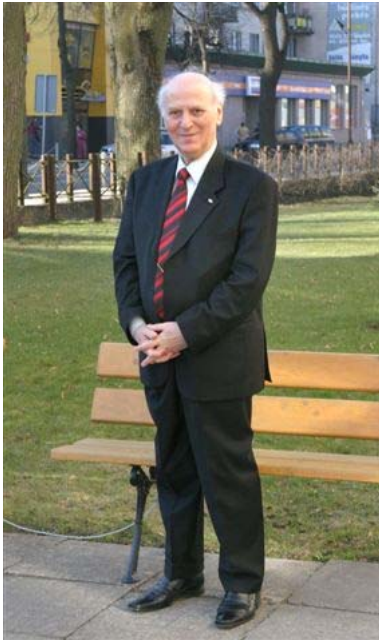
Šalva Amonašvilis

Toliau publikuojame ištrauką (pradžią - PAPA-41) iš žy- maus Humanistinės pedagogikos puoselėtojo Šalvos Amonašvilio knygos „Gyvenimo mokykla. Mokyklos tiesa“ (253-254 p.).